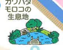
カワバタモロコの生息地