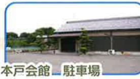
本戸会館 駐車場 堤防まで 50m