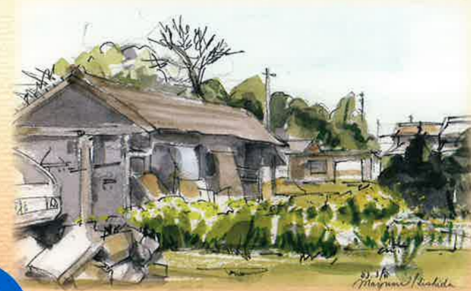
倉庫前に咲く菜の花