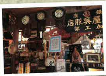
正光寺の「げてももの館」