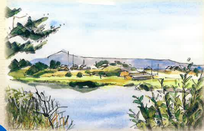
大樽川の左岸堤から 下大樽集落を望む