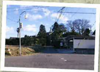
旧大樽川堤防の上に建つ集落