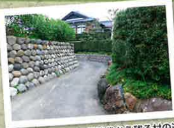
江戸時代から残る村の道