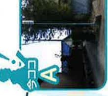
福東新田901番地の1先