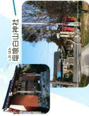
白山神社 塩喰白山神社

福東新田の氏神様で、昭和63年に今のように整備された。輪之内町では数少ない白山神社で石灯笼が32基並び美しい。西には列状集落が連なる。