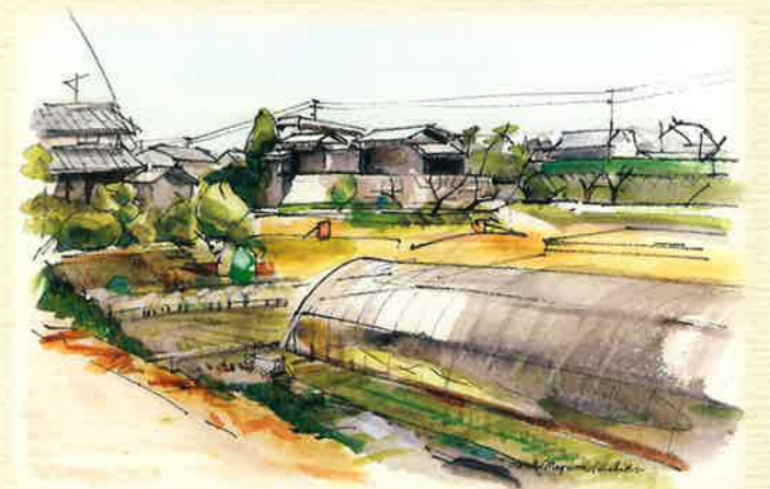
水屋の見える風景