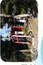
篠池新田稻荷神社